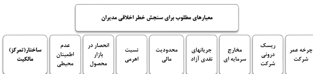
نمودار (۲): ساختار سلسله مراتبی

اولین گام به منظور رتبه بندی معیارهای انتخاب شده توسط فرایند تحلیل سلسله مراتبی (GAHP)، تشکیل ساختار سلسله مراتبی معیارها می باشد (نمودار ۲).