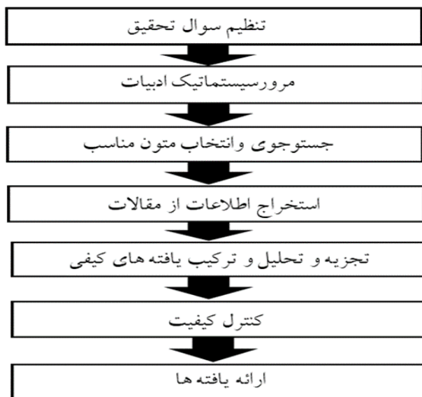
شکل شماره ۲. مراحل پیاده‌سازی فراترکیب (باروس و ساندلوسکی، ۲۰۰۶).

با بررسی و انجام موارد فوق، بسترها به‌منظور ارائه یک خط‌مشی در به‌کارگیری اینترنت اشیا فراهم می‌شود. در تحقیق حاضر به‌منظور تحقق هدف مطالعه، با بهره‌گیری از فرایند هفت مرحله‌ای «ساندلوسکی و باروس» ۱ ، پژوهش‌های گذشته در حوزه سیاست‌ها، الزامات و یا خط‌مشی‌گذاری در فناوری‌های دیجیتال و یا اینترنت اشیا بررسی شده است. خلاصه این مراحل در شکل (۲) مشخص شده است. بر مبنای مراحل بیان‌شده در این شکل، پیاده‌سازی روش فراترکیب در بخش تحلیل یافته‌ها تشریح شده است.