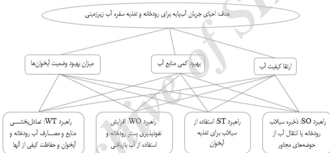
شکل ۳. نمودار سلسله‌مراتبی مربوط به هدف احیای جریان آب پایه برای رودخانه و تغذیه آبخوان

در این تحقیق برای تحلیل حساسیت نتایج، وزن هر معیار