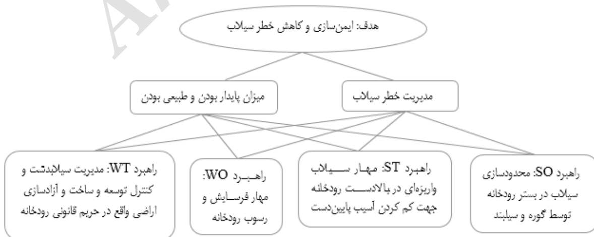
شکل ۴. نمودار سلسله‌مراتبی مربوط به هدف ایمن‌سازی و کاهش خطر سیلاب