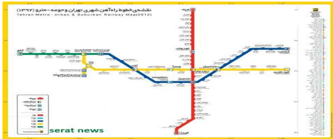
شکل ۲. خطوط و ایستگاه‌های مترو فعال در تهران

بوده و از ۱۶ تا ۴۵ سال سن داشتند. معیارهایی که برای ارزیابی این خطوط مورد استفاده قرار گرفته‌اند در جدول ۱ آمده است. و گزینه‌ها خطوط A۲ (خط قرمز)، A۱ (خط آبی)، A۳ (خط زرد) و A۴ (خط سبز) می‌باشد. پس از اینکه نتایج نظر سنجی و داده‌های حاصل از پرسشنامه به فرم اعداد فازی مثلی تبدیل شد، از رویکرد تاپسیس فازی برای انتخاب بهترین خط استفاده می‌شود.