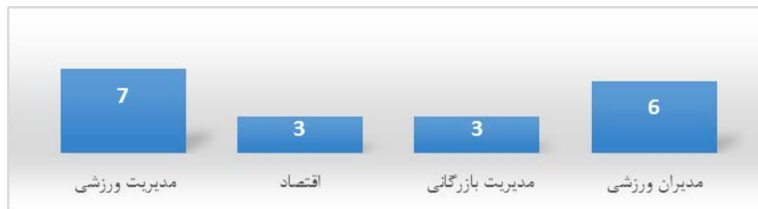
نمودار ۱. ترکیب خبرگان پژوهش با توجه به تخصص بر حسب تعداد

نتایج بخش توصیفی مربوط به ویژگی‌های جمعیت‌شناختی بخش کیفی پژوهش نشان داد که ۲۶/۳ درصد آنها زنان و مابقی مردان بودند. بیشتر آنها دارای تحصیلات دکتری بودند (۸۴/۲ درصد).