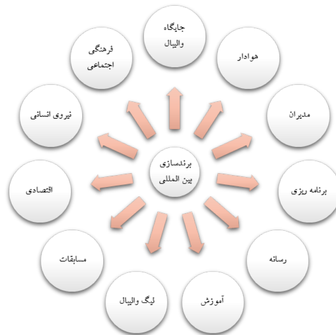
شکل ۱. مدل نهایی بین‌المللی سازی برند باشگاه‌های لیگ برتر والیبال

نتایج جمعیت‌شناختی بخش کمی نشان داد که مردان اکثریت تعداد نمونه‌ها را تشکیل می‌دادند (۷۹ درصد). بیشتر نمونه‌ها دارای تحصیلات دکتری بودند (۸۳/۷ درصد) و میانگین سنی نمونه‌ها ۴۱/۹ سال بود. در بخش کمی، نتایج نشان داد که چولگی بین ۳ و ۳- و کشیدگی بین ۵ و ۵- قرار دارد و به ازای هر متغیر، ۳ گویه وجود دارد؛ اما تعداد نمونه‌های پژوهش کمتر از ۲۰۰ نفر است؛ بنابراین در این پژوهش، از نرم‌افزار واریانس محور پی‌ال‌اس استفاده می‌شود. برای بررسی برازش مدل‌های اندازه‌گیری، سه معیار پایایی، روایی همگرا و روایی واگرا استفاده می‌شود و پایایی خود از سه طریق بررسی ضرایب بارهای عاملی، ضرایب آلفای کرونباخ و پایایی ترکیبی صورت می‌پذیرد (جدول ۴).