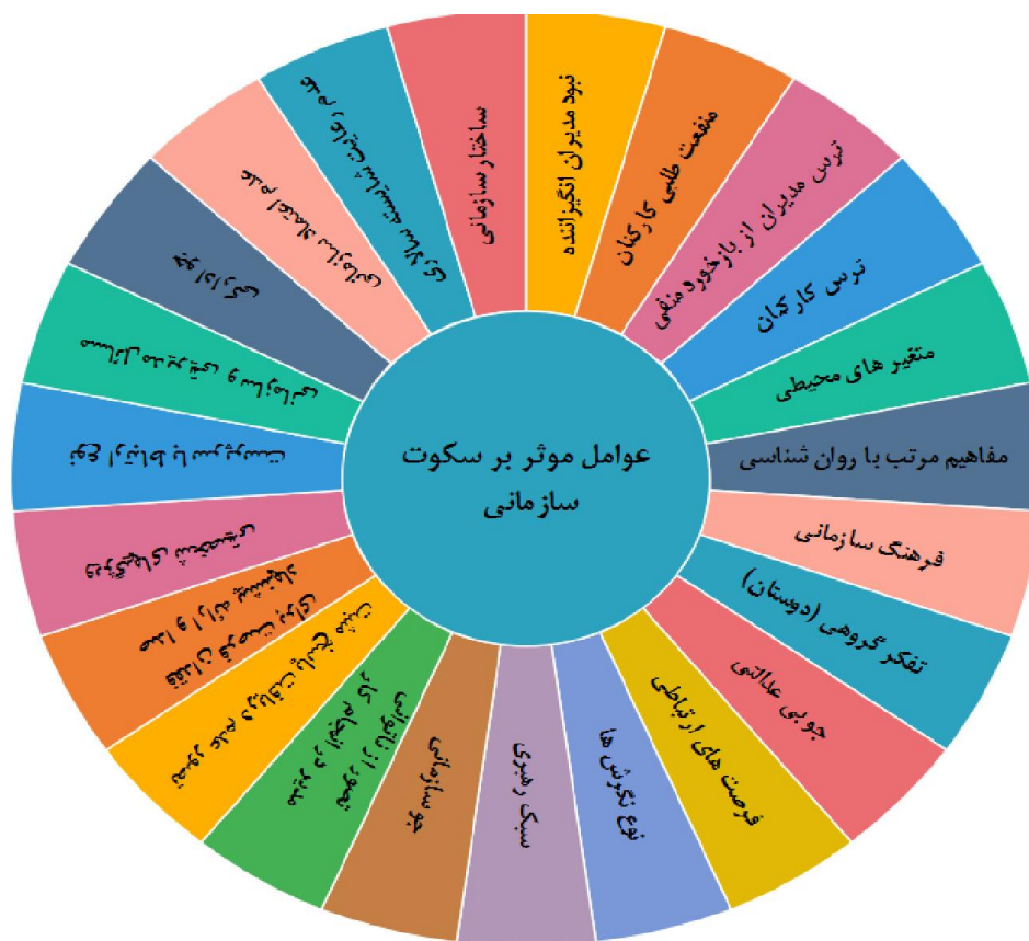
شکل ۳: مدل تحقیق

بعد از غربال سازی عوامل موثر بر سکوت سازمانی شناسایی شده، مدل تحقیق به شرح زیر تدوین گردید.