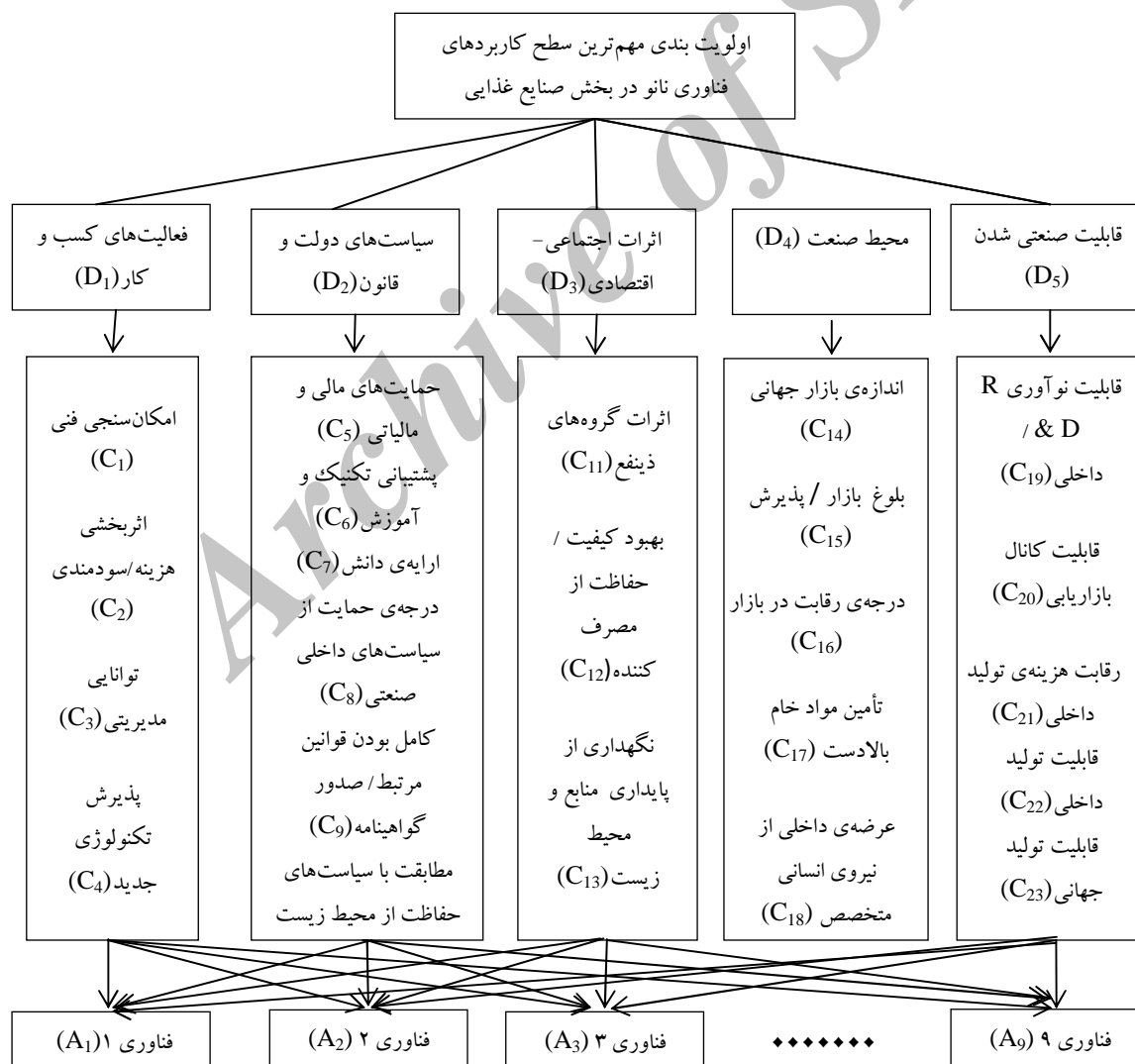
شکل ۲. ساختار سلسله مراتبی انتخاب مهم ترین کاربردهای فناوری نانو در بخش صنایع غذایی