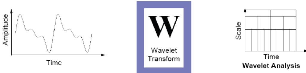
شکل ۲. طرح شماتیکی از یک موجک (۸)

تفاوت که موجک‌های سیملت متقارن اند. موجک‌های سیملت (Sym) با مرتبه ۱ همان موجک هار محسوب می‌شود. مرتبه این گروه از موجک‌ها از دو تا هشت است (۲ و ۸ و ۱۲)